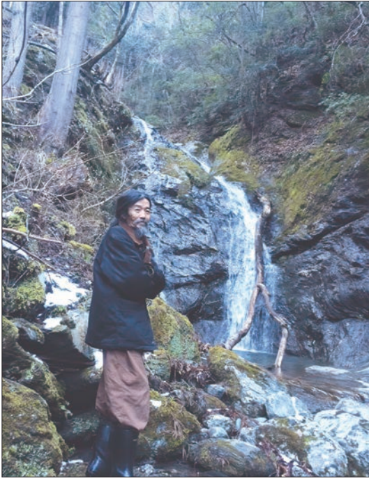
津志嶽からの清流の滝の近く