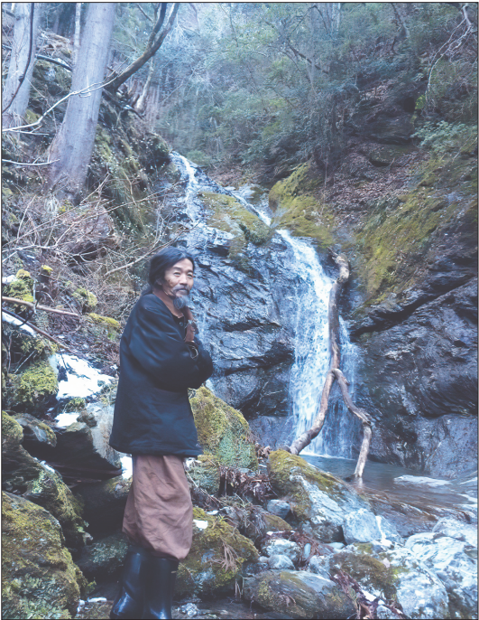
津志嶽からの清流の滝の近く